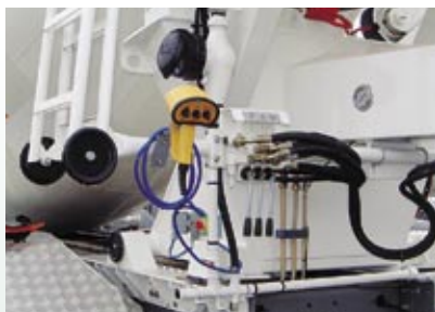
Pulsantiera ergonomica JOY user-friendly Ergonomic and user-friendly JOY Pushbutton

Water tank: 1000-l capacity, in aluminium, with steel high-resistant support