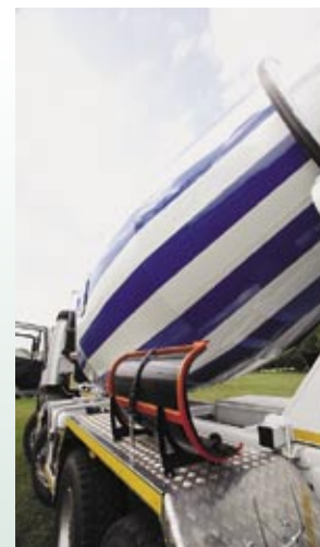
Canale superleggero in polystone Superlight polystone extension chutes