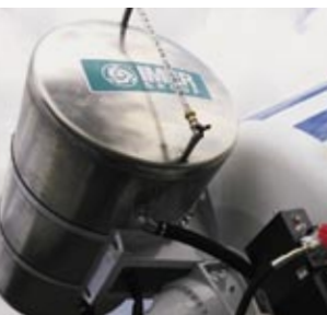
Serbatoio acqua da 1000 l in alluminio con sella in acciaio ad alta resistenza

The IMER Group's study on steels and the use of IMER WEAR steel has made it possible to lighten the machine and increase its resistance to wear compared with the materials commonly used.