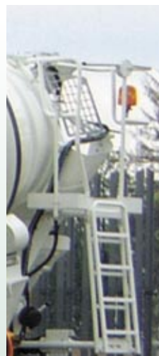
Rete di protezione Safety net