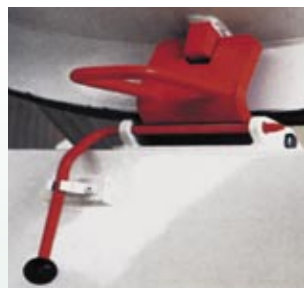
Blocco meccanico antirrotazione Antirotation mechanical lock